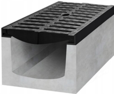
Poglądowy wygląd korytka odwodnieniowego betonowego z rusztem

Korytka odwodnieniowe o szerokości 16cm i wysokości dobranej do potrzeb uzyskania odpowiedniego spadku. Połączenia korytek należy uszczelnić (fugować) klejem mrozoodpornym lub uszczelniaczem poprzez nałożenie kleju na ściankę czołową kanału i dociśnięcie kolejnym układanym elementem.